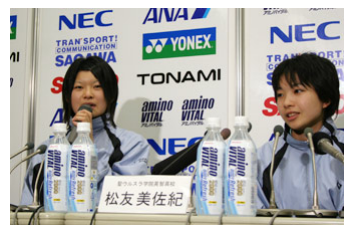
女子ダブルスで高校生の全日本総合ベスト4進出は、80年代以降では初めてのことだった