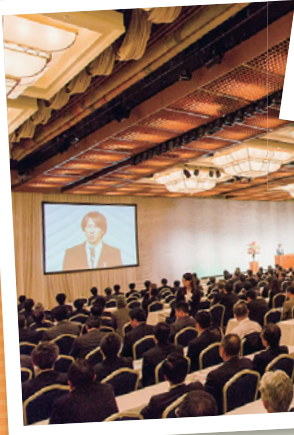
記念講演はスキージャンプの葛西紀明氏