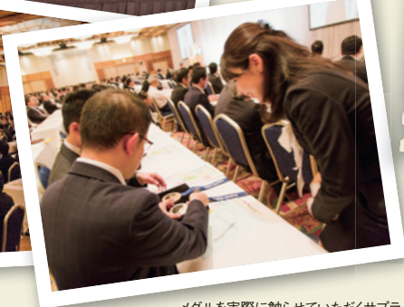
メダルを実際に触らせていただくサプライズも

2014年10月10・11日、北海道の札幌パークホテルを主会場に「全国フォーラム2014」を開催しました。