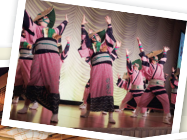
今や北海道では おなじみとなった 「YOSAKOIソーラン」