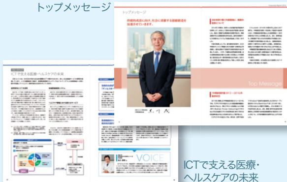
ICTで支える医療・ヘルスケアの未来