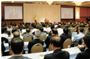
2007年度全国フォーラム(名古屋にて開催)

名古屋開催となった2007年度フォーラムでは、中部地区における「モノづくり」などをテーマとしたプログラムにおいて600名を超える会員のみなさまに参加いただきました。またフォーラムに先立ち行われた中部支部幹事のみなさまによる座談会では、フォーラムの成功に向けた活発な意見交換がなされました。