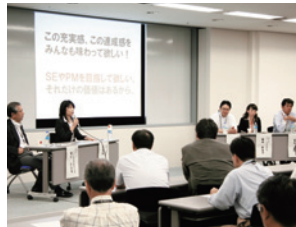
「日本ユニシス版プロジェクトX」

社員一人ひとりの技術力の向上や、組織としての技術の蓄積・向上を目的としたイベント「テクニカル・シンポジウム」の一環として、「パネルディスカッション」や「アフター5セミナー」を定期的に開催し、毎回多くの社員が参加しています。2007年9月に行われた第6回「パネルディスカッション」では、『日本ユニシス版プロジェクトX』～SE栄光物語～と題し、プロジェクトマネージャとしてシステム開発を成功に導いたSE社員4名による現場の体験談が展開され、プロジェクトマネジメントのノウハウ共有や、参加した社員のモチベーション向上に役立てられました。