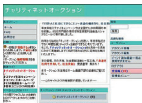
チャリティネットオークション画面

2007年度の販売会では新たな試みとして、イントラネットを利用したチャリティネットオークションを実施し、キャンペーン全体としての収益金は、190,765円となりました。本収益金は特定非営利活動法人シャプラニール(=市民による海外協力の会)の「子どもの夢基金」を通じて国際協力に役立てられます。