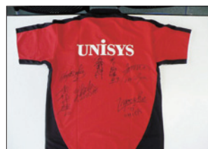
出展品の例： 日本ユニシス実業団バドミントン部選手 サイン入りシャツ