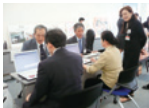
目の不自由な方のパソコン使用体験

「ユニハート」の寄付がどのような団体でどのように使われているのかを広く社員に知ってもらうため、「寄付先展示会」を実施しました。すべての寄付先団体の資料展示を行うとともに、団体の方による説明や体験コーナーも設置。目の不自由な方がどのようにパソコンを使用しているか体験したり、音声ガイドつき映像メディアの視聴体験、病気と闘う子どもたちを応援する施設で使う掃除用使い捨て布づくりなども行いました。寄付先団体の方々と社員が触れ合う貴重な機会となりました。