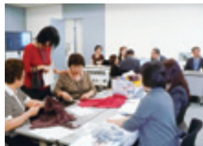
掃除用使い捨て布づくり