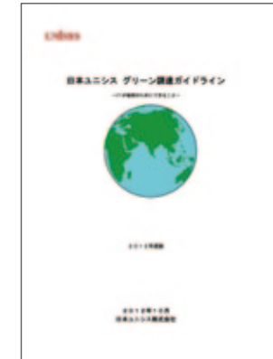
日本ユニシス グリーン調達ガイドライン

また、「日本ユニシス グリーン調達ガイドライン」に従って、環境保全を推進しているお取引先からの調達、環境負荷が少ない製品・サービスなどの調達は推進しています。