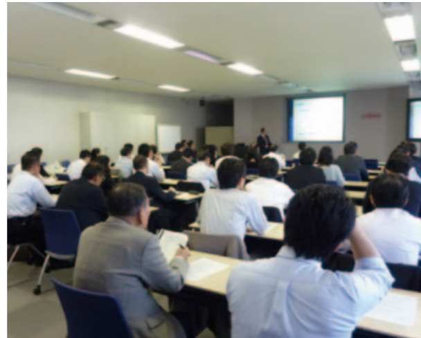
協力会社様向け業務説明会