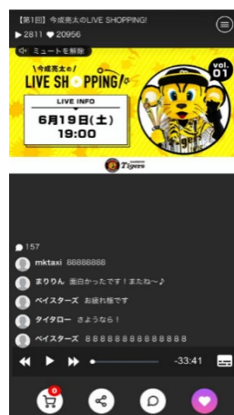
ライブ配信ページ