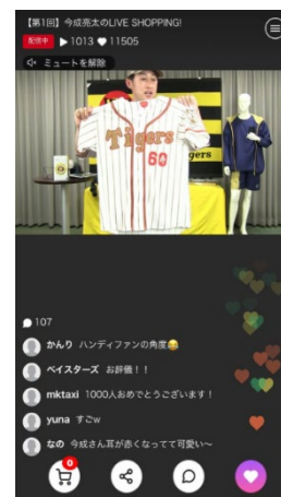
ライブコマース配信の様子