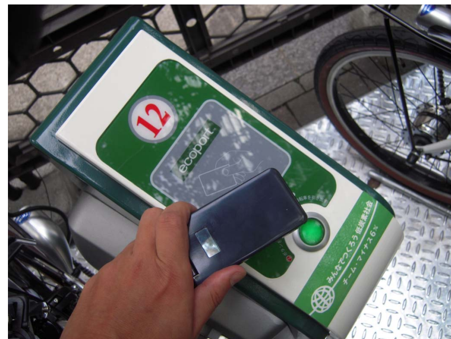
おサイフケータイで利用者認証