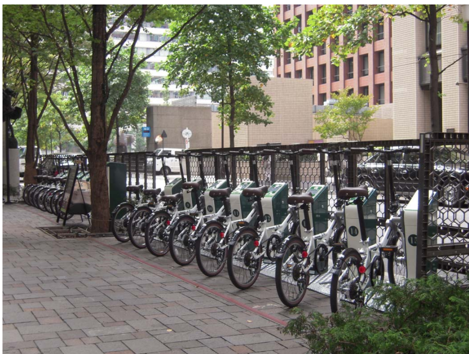
大丸有地区のサイクルポート(自転車貸出・返却拠点)

東京・大手町、丸ノ内、有楽町エリアで実施中。 非接触ICカードを用いた利用者認証による自動貸し出しシステムを実現。