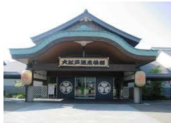
イメージ (大江戸温泉物語 カーシェアリングステーション)