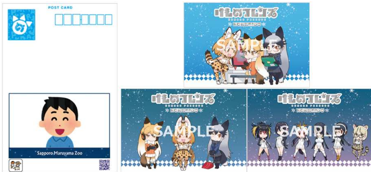
『けものフレンズ』動くポストカードセット（3枚セット）：600円（税込）

購入者は、コミュニケーションロボット「Sota ® （ソータ）」 （注1） の声かけにより写真と動画を撮影することができます。撮影された写真や動画は、その場でARアプリ「タメスコ ™ 」 （注2） のクラウドセンターに登録されるため、自身で写真や動画を撮って登録するなどの手間がかからず、手軽にAR付きのサービスを利用することができます。